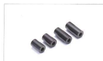
Kit di collari per il fissaggio delle borse laterali.