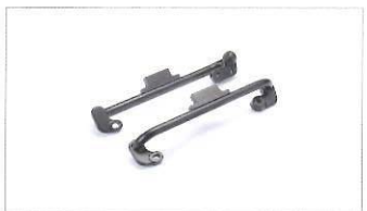
Barre per borse laterali.