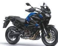
XT1200ZE Super Ténéré