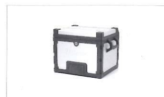
Bauletto in alluminio bianco.