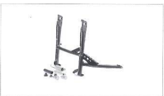
Kit cavalletto centrale.