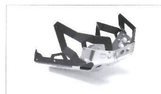
Kit estensione piastra para motore.