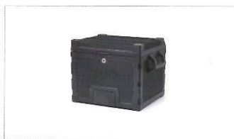
Bauletto in alluminio nero.