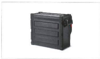
Borsa laterale in alluminio nero.