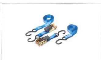
Cinghie con cricchetto.