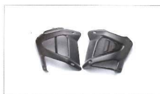
Pannelli laterali in carbonio.