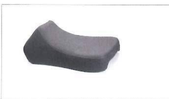
Sella bassa nera.