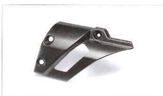
Copri scarico in carbonio.