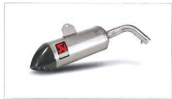
Terminale di scarico Akrapovic.