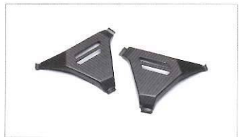
Protezioni telaio in carbonio.