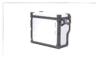
Borsa laterale in alluminio bianco.