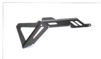
Protezione freno posteriore.