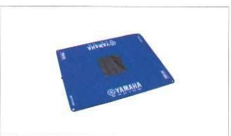
Tappetino da lavoro.