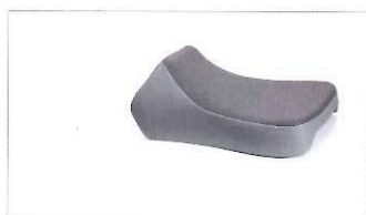
Sella bassa grigia.