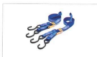
Cinghie con chiusura a fibbia.