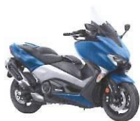
TMAX DX ABS