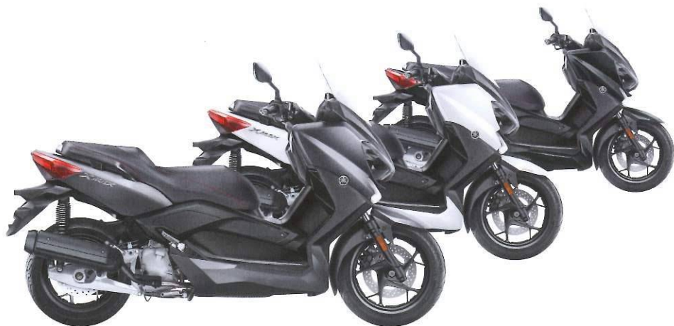
Stonehenge grey / Absolute White / Matt Grey