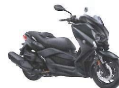
X-MAX 400 ABS