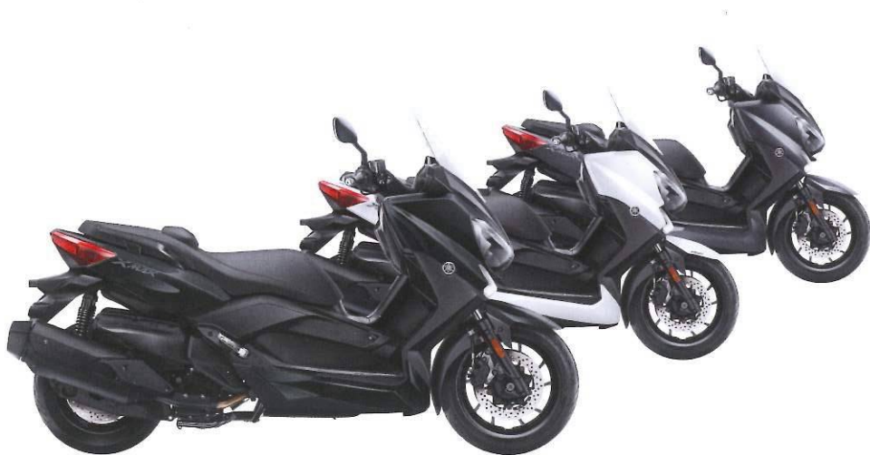
Stonehenge Grey / Asbolute White / Matt Grey