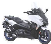
TMAX SX ABS