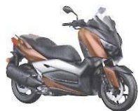
X-MAX 300 ABS