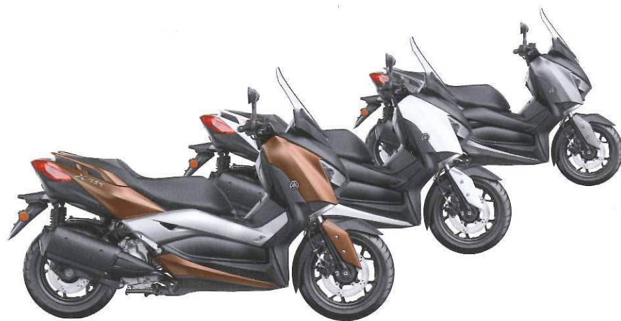
▲ Quasar Bronze / Milky White / Matt Grey