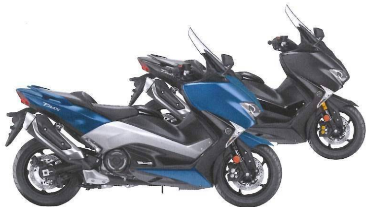
Phantom Blue / Liquid Darkness