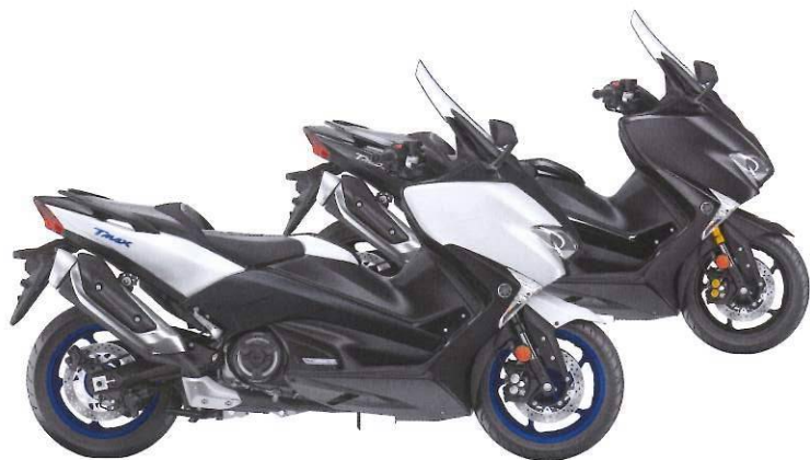
▲ Matt Silver / Liquid Darkness