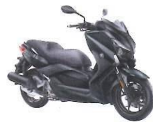
X-MAX 125 ABS