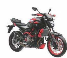
MT-07 Moto Cage / ABS