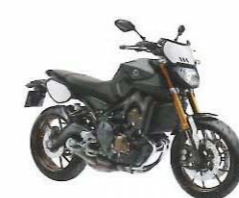
MT-09 Sport Tracker / ABS