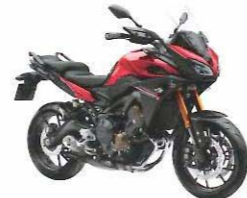
MT-09 Tracer / ABS