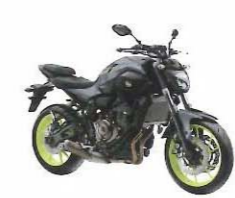
MT-07 / ABS