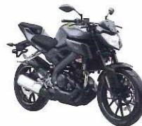
MT-125 / ABS