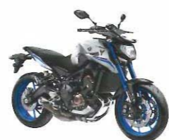
MT-09 Street Rally / ABS